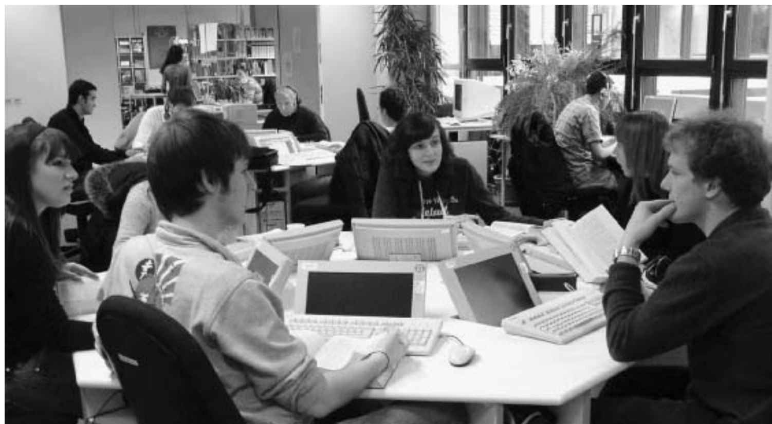
In den so genannten Selbstlernzentren steht den Sprachschülern eine Vielzahl von Lernprogrammen zur Verfügung.

> Wer mehr über die Tagung und das Fremdsprachenzentrum erfahren möchte, kann sich im Internet unter der Adresse www.fremdsprachenzentrum-bremen.de informieren.